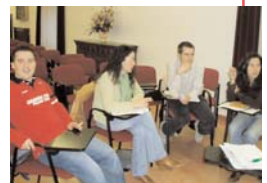
Compañeros y compañeras de Castilla y Leon en un taller de la Escuela

Se desarrollo del 8 al 10 de abril y en ella participaron alrededor de noventa sindicalistas jóvenes de la región. La temática de la misma a lo largo de las ponencias giró en torno al Diálogo Social, tanto en la región como en el conjunto del estado. Además los talleres profundizaron en diversos aspectos del empleo que afectan principalmente trabajadores y trabajadoras jóvenes.